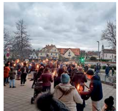
Start des Fackelumzugs von der Rosenschule zum Scheibenfeuer