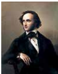
Felix Mendelssohn Bartholdy

Kontaktaufnahme und weitere Informationen über www.kammerchor-muellheim.de oder www.albrechthaaf.de