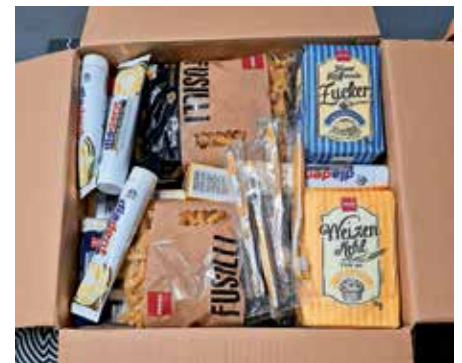
Paket mit haltbaren Lebensmittel und Hygieneartikel

Diese Aktion kann natürlich auch von Nichtmitgliedern der SPD genutzt werden und jeder, der hier mitmacht, tut etwas Gutes für die notleidende Bevölkerung in der Ukraine. Es ist sicherlich eine schöne humanitäre Geste, wenn zu Ostern das ein oder andere Paket ein wenig Freude in die Not mancher Familie bringt. Das erste Paket des Vorsitzenden ist fertig und geht jetzt zur Post. Möge diese Aktion ebenso erfolgreich sein wie die Sammlung für die Tafel.